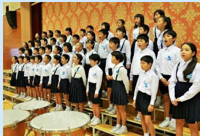
合唱「ヒリーブ、この☆のゆくえ」 合奏「ラブソディー・イン・ブルー」