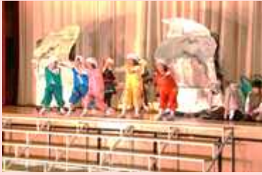
劇「アイウエオリババ」