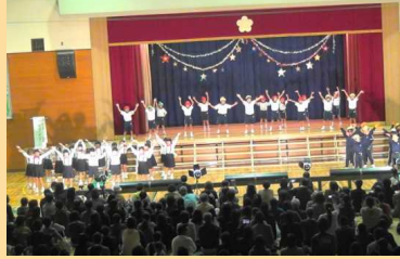
ダンス「レッツ ダンス！」