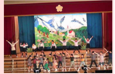
音楽劇「サウンドオブミュージック」