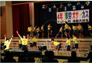
運動表現「4年博労大サーカス」